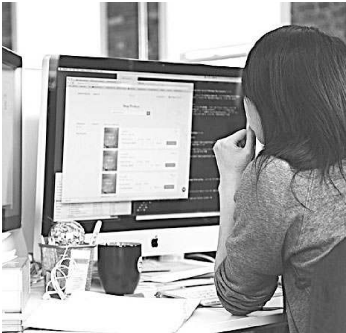
Betmedia es una empresa de base tecnológica y marketing digital.

Asenjo mira al futuro y afirma que Ceuta es un buen lugar no solo