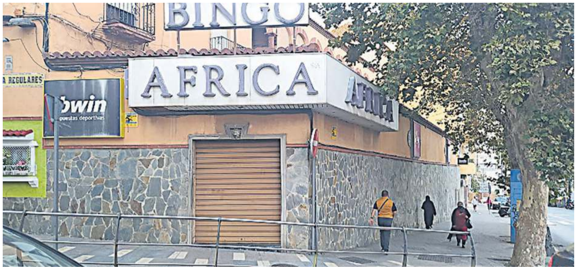
En los últimos años han sido decenas las empresas relacionadas con el juego online las que se han instalado en la Ciudad Autónoma.