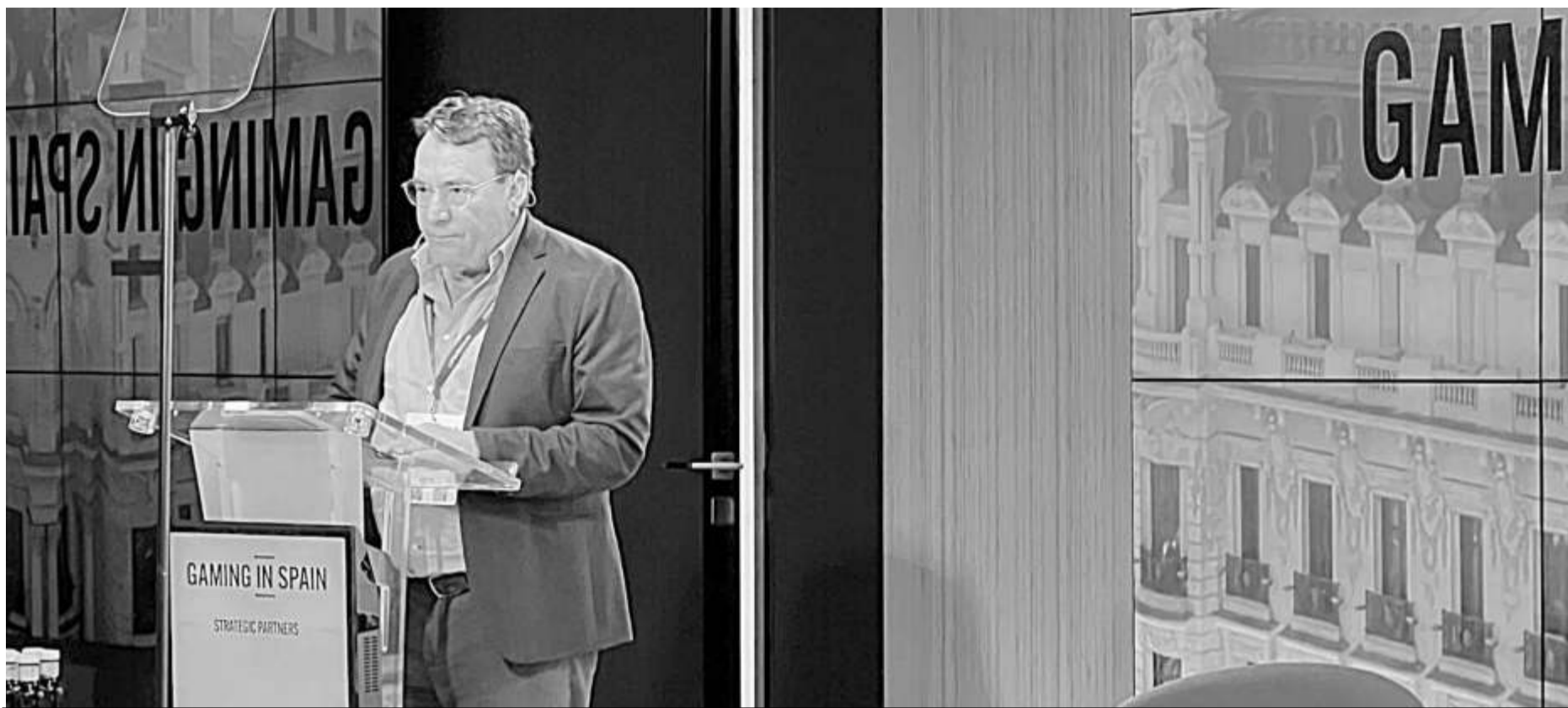
El director general de la compañía JDigital vendrá desde Madrid para participar como moderador durante las jornadas.