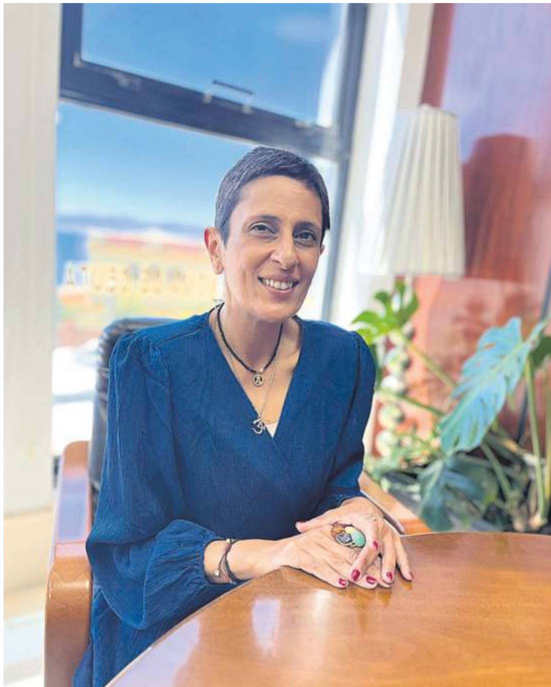
La consejera destaca la unidad de acción como una de las claves para la transformación económica de Ceuta.

sistema también es bueno para nuestros jóvenes.