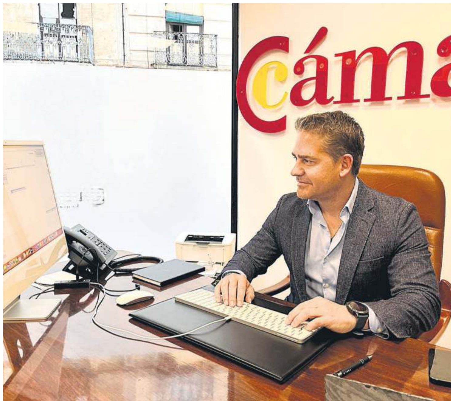
Recientemente, la Cámara de Comercio organizó en Ceuta un gran evento para atraer inversores y startups a la ciudad.

Vamos a tener en breve, además, una incubadora de inteligencia artificial que estará operativa en 15 meses y estamos trabajando con la Universidad de Granada para, efectivamente,